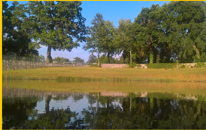
foto: lagheto di Lipizza